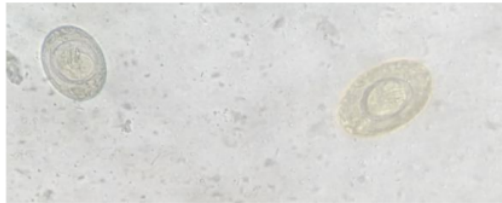
Gambar 1. Hymenolepis nana pada Konsentrasi Pengapungan